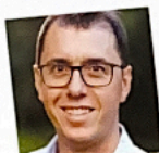
Stefano Marinaz www.stefanomarinaz.com