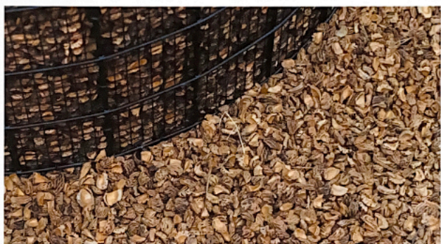
Detail van de perzikstenen halfverharding die terugkomt in de schutting-wanden en de bakken. Het hergebruik van de keiharde pitten is een duurzame toepassing van dit restmateriaal. Ze gaan 25 jaar mee en worden niet groen. Wanneer de pitten zijn gebroken en voorzien van matten, zijn ze als oprit te gebruiken. Ook rolstoelen kunnen er dan goed overheen rijden.

De Floriadebezoekers reageren verast als ze de tuin van EuroParcs binnengaan. De bijzondere bomen, de fraaie beplanting, opvallende details en de natuurlijke, waterdoorlatende halfverharding van gebroken perzikpitten nodigen uit om plaats te nemen in de schaduw onder het 'huis op voeten', of juist in de zon te barbecuën en een vuurtje te stoken. Alles is aanwezig voor een relaxte vakantie met vrienden en familie. Weg met het grasveldje met struiken eromheen; de gebruikelijke invulling van tuinen op een vakantiepark. Het ontwerp is organisch, heeft golvende lijnen, zachte vormen en een natuurlijke beplanting. Het draagt duidelijk de signatuur van de ontwerper en zijn visie op tuinen.