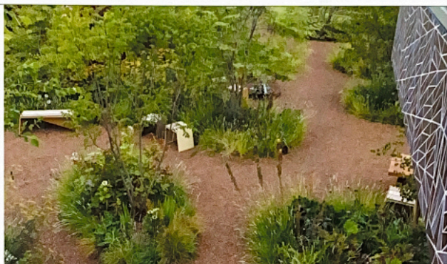
Het uitzicht vanaf de trap naar The Rebel House. Meerstammige bomen geven een transparanter en natuurlijker beeld in een tuin. Goed te zien is dat Marinaz losse plantengroepen en organische vormen heeft toegepast.